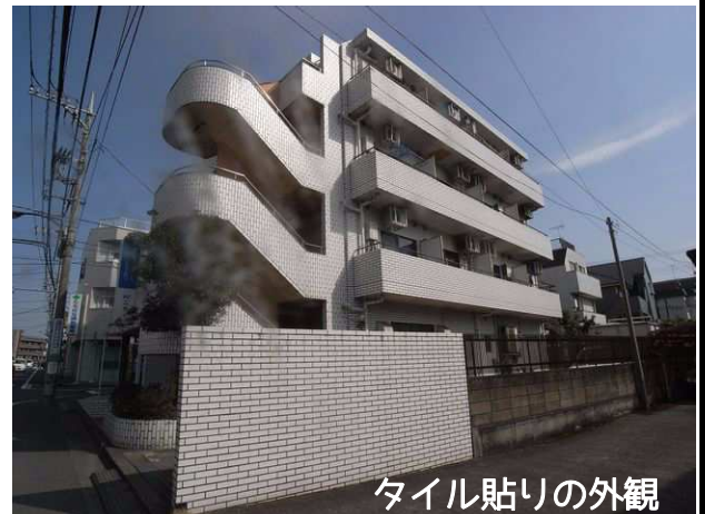
タイル貼りの外観

全自動洗濯機・サイクロン掃除機・電子レンジ・炊飯器・オーブントースター 無料でサービス！上京には最適！！※期間内解約の場合、違約金あり（下記参照）