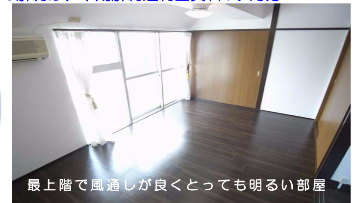
最上階で風通しが良くとっても明るい部屋

※図面と現況が相違する場合は、現況を優先いたします。※万一契約済の際は、あらかじめご了承ください。※鍵交換代21,600円契約時要。※更新手数料5,400円 ※退去時清掃代54,000円要