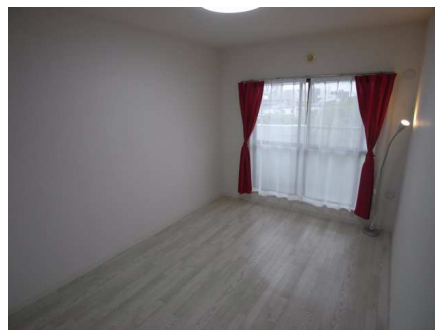
バルコニー付き日当たり最高!