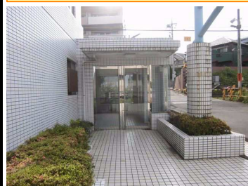
きれいなエントランス