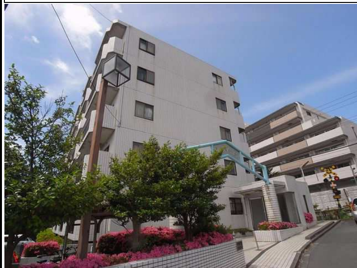
タイル張り、南向き