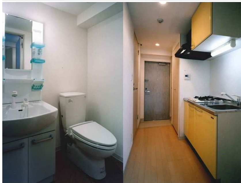
シャンプードレッサーとトイレ / システムガスキッチン