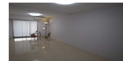
11.7帖のスーパー1Kでゆとりライフ