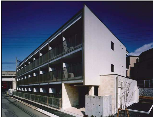
スタイリッシュな外観