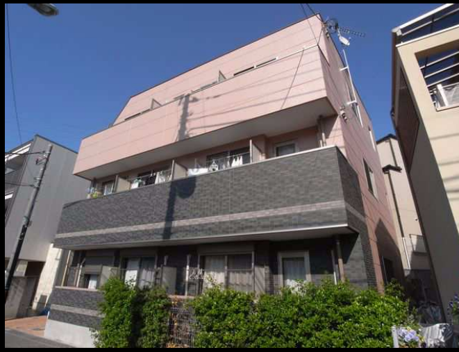
かわいらしいタイル張りの外観