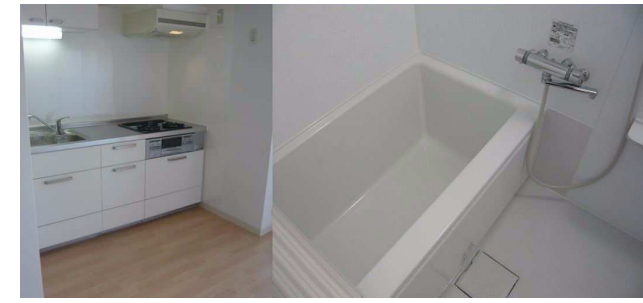
システムキッチンとユニットバス

※図面と現況が相違する場合は、現況を優先いたします。※万一契約済の際は、あらかじめご了承ください。