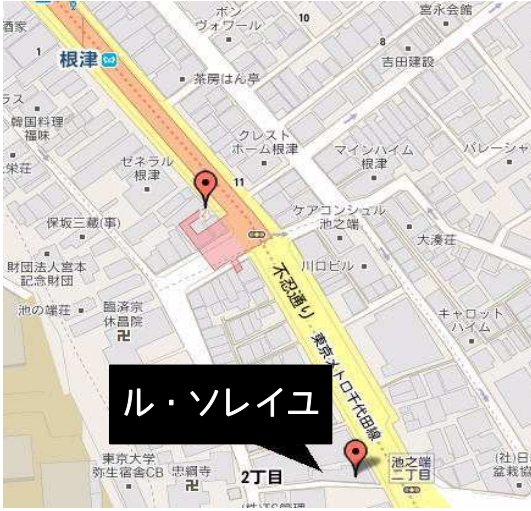
根津駅徒歩2分の好立地

賃貸条件 礼金: 1ヵ月 敷金: 1ヵ月 (ペット各礼敷1ヶ月UP) 駐車場: なし (近隣35000円位) 更新料: 新賃料の1ヶ月分+5,000円(税別) 保証会社: 加入必須 駐輪場: なし ※契約時鍵交換費用21,600円要 ※火災保険料: 20,000円/2年間