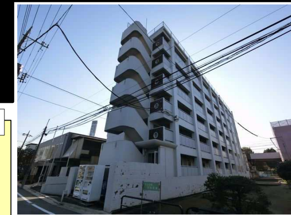
地震に強いRCマンション

東京都知事免許(12)第26709号 (社)全国宅地建物取引業保証協会会員 (社)東京都宅地建物取引業協会会員営業部