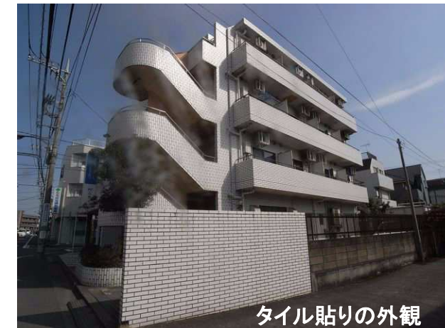
タイル貼りの外観