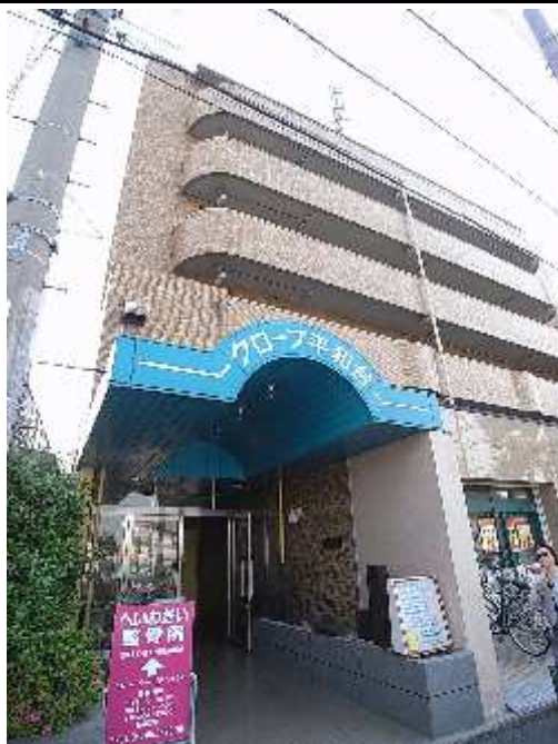
ペット可駅近マンション