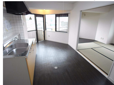
明るいキッチンと和室