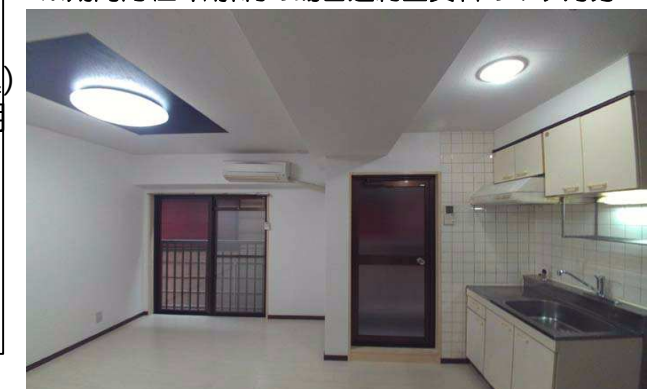
スタジオタイプで広々

礼金：なし ※ペット飼育の場合 敷金：なし 礼金・敷金各1ヶ月追加 駐車場：なし 更新料：新賃料の1ヶ月分+事務手数料8800円 火災保険料：17,000円/2年 保証会社：加入必須 保証料50%~ 鍵交換費用：22,000円契約時要 退去時清掃代：42,900円契約時要 ペット条件：礼金・敷金各1ヶ月UP 事務所使用：敷金2ヶ月UP (1ヶ月償却) ※期間内(2年)解約の場合違約金賃料の1ヶ月分