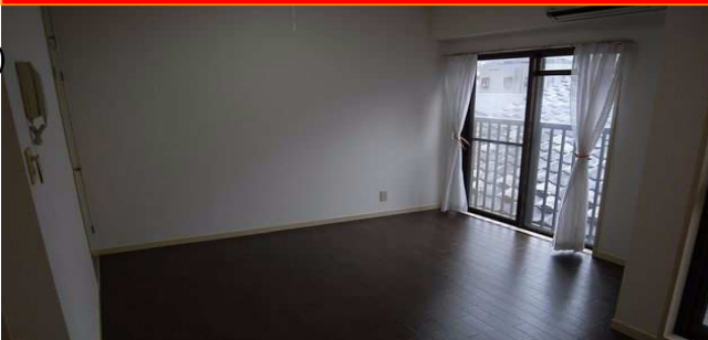
スタジオタイプで広々

※図面と現況が相違する場合は、現況を優先いたします。※万一契約済の際は、あらかじめご了承ください。