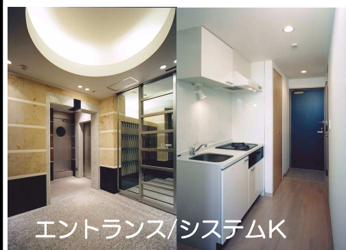
エントランス/システムK