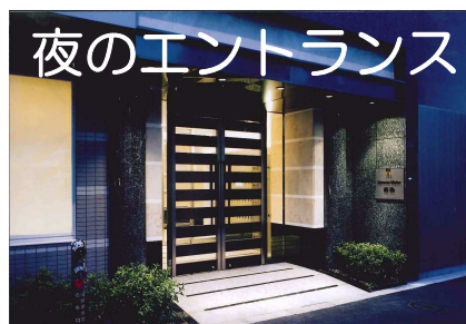
夜のエントランス