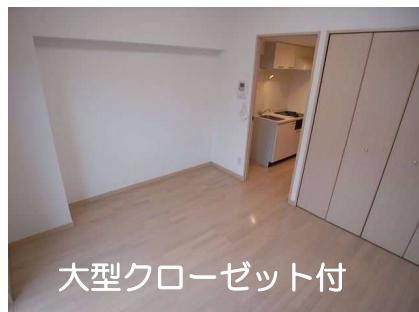
大型クローゼット付