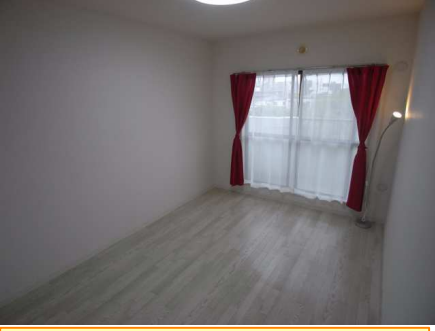
バルコニー付き日当り最高!