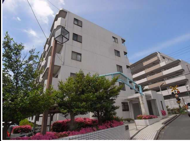
タイル張り、南向き

賃料：78,000円 共益費：5,000円 礼金：なし 敷金：なし 駐車場：12,100円 バイク：5,500円 更新料：新賃料の1.5ヶ月分+手数料8,800円 保証会社：カーサorセーフティ必須50%～ 鍵交換費用：22,000円契約時要 火災保険料：20,000/2年間 退去清掃費：58,500円契約時要 ライフサポート：12,000円/2年(契約時要) ※期間内解約違約金有り(賃料の1ヶ月分)