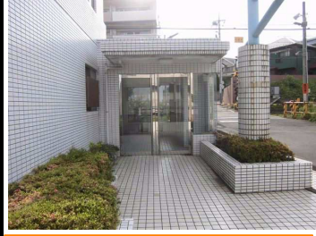
きれいなエントランス