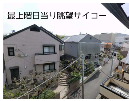
最上階日当り眺望サイコー