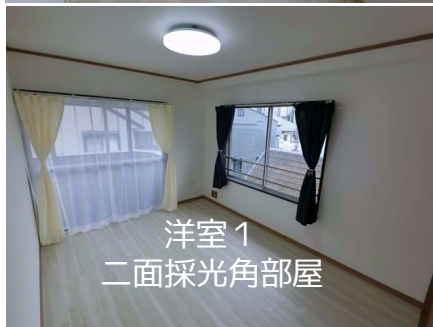
洋室1 二面採光角部屋