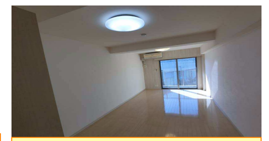
11.7帖のスーパー1Kでゆとりライフ