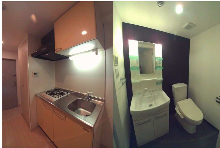
システムガスキッチン / シャンプードレッサーとトイレ