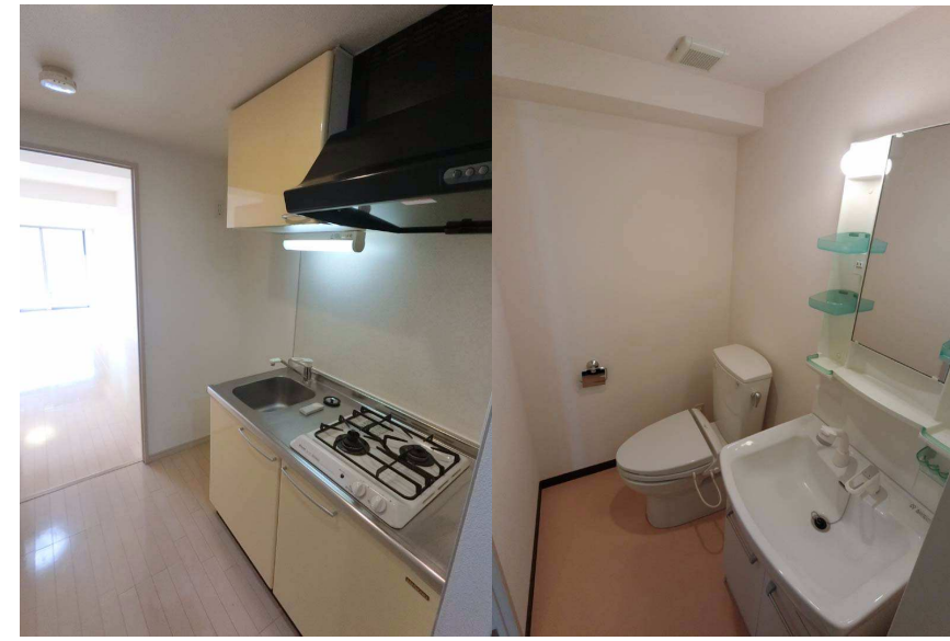
システムガスキッチン / シャンプードレッサーとトイレ

交通アクセス 東京メトロ有楽町・副都心線 地下鉄成増駅 徒歩9分 東武東上線 成増駅 徒歩11分 渋谷まで乗り換えなし