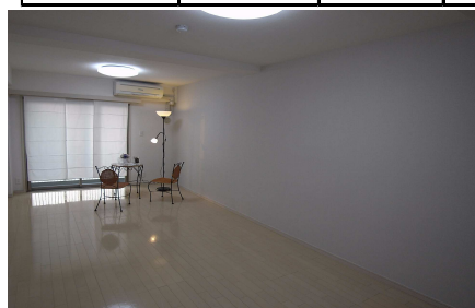
11.7帖のスーパー1Kでゆとりライフ