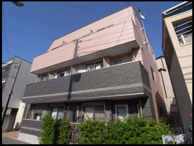
かわいらしいタイル張りの外観