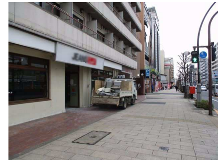
川崎街道沿い前面スペースと歩道