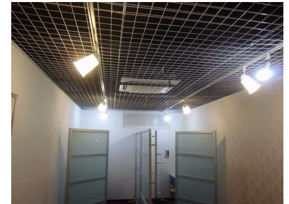
ビジュアルチックな内装