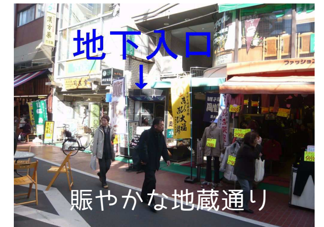
賑やかな地蔵通り

※図面と現況が相違する場合は、現況を優先いたします。※万一契約済の際は、あらかじめご了承ください。