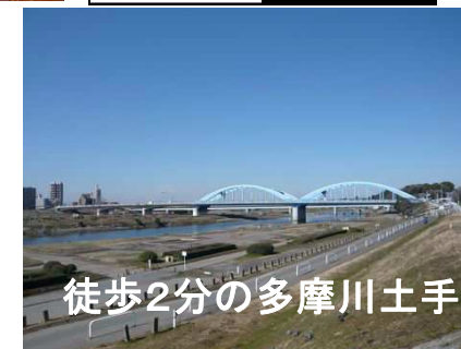
徒歩2分の多摩川土手